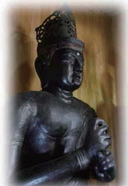
内郡日吉神社 大日如来坐像