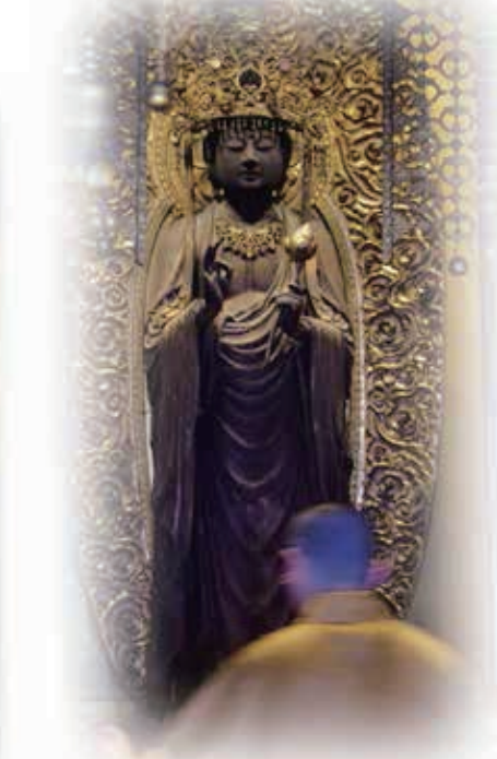
朝日観音福通寺 正観音立像