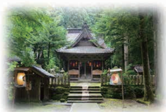
天王八坂神社 社殿