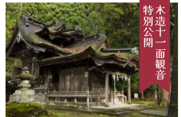
木造十一面観音特別公開

八坂神社には頭が十一面で顔からは女神の姿という神仏習合を現す珍しい女神坐像が安置されています。